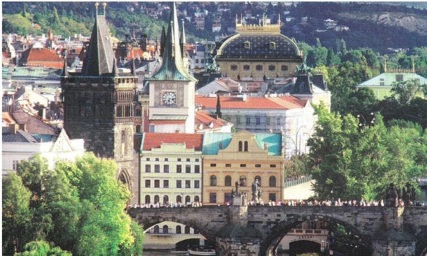
カレル橋と国民劇場(プラハ)