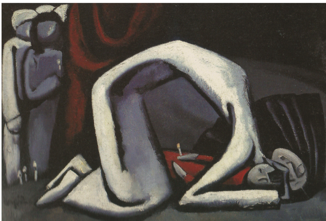
「マドンナ」1982 キャンバス・油彩 70×100cm